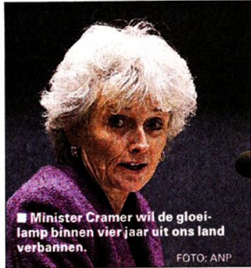
■ Minister Cramer wil de gloeilamp binnen vier jaar uit ons land verbannen.