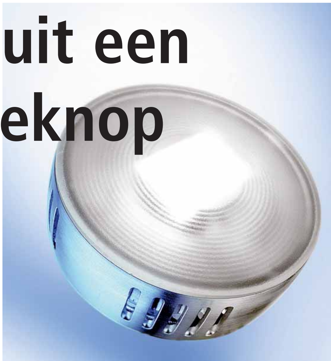
Osram Ostar: 4 of 6 leds in één voor een vermogen van respectievelijk 10 of 15 watt.

Ledlampen zijn zeer kleine diode-lampjes die populair zijn geworden door de microreflector en de lensjes die de functionaliteit sterk verhogen. Omdat ze zo klein zijn, worden ze geleverd als cluster, strip of matje. Net als OLED-lampen bieden ze volledig toepassingsmogelijkheden. Plafond & Wand praat u bij.