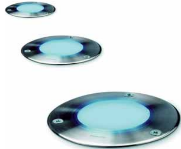
Philips Marker: Superflux-leds met een diffuse glazen ruit. Kan dienst doen als markeerlicht met gelijkmatige lichtopbrengst.

toe te passen. Met deze op small-molecule gebaseerde technologie heeft het bedrijf een voorsprong, die het ook wil benutten in de sector van algemene verlichting. Tot op heden worden OLED's alleen gebruikt in mobiele ap-