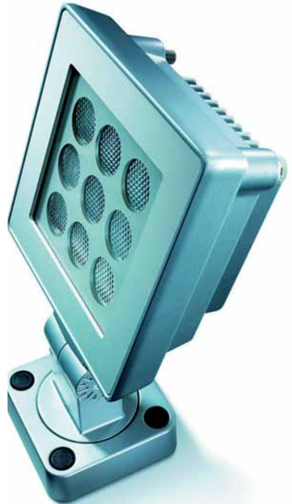
Philips LEDflood RGB/AWB: voor het met gekleurd licht verlichten en accentueren van structuren. De RGB-versie is geschikt voor DMX-lichtregeling en maakt dynamische kleurvariatie mogelijk. Met AWB-versie kunnen alle tinten daglicht worden gecreëerd.

sieobjectieven aangestraald, zodat al het beschikbare licht volledig op de kolom wordt gestraald. Het resultaat is verbluffend. Een ander imposant ver-