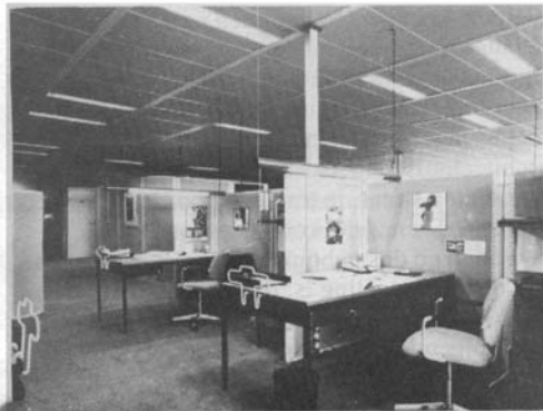
Flexibele plafondtechniek: maakt het mogelijk plaats en hoeveelheid licht in het laatste stadium te bepalen

orescentielamp in relatie tot daglicht erg kil, koud en blauw lijkt, is het zonlicht veel 'kouder'.